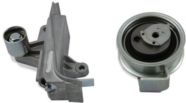
画像 1：振動ダンパー 533 0028 20 (左)、 テンショナー 531 0531 20 (右)

部品番号： 531 0531 20 (交換前) 533 0028 20 (交換前) 530 0546 09 (新/セット) 530 0546 10 (新/キット)